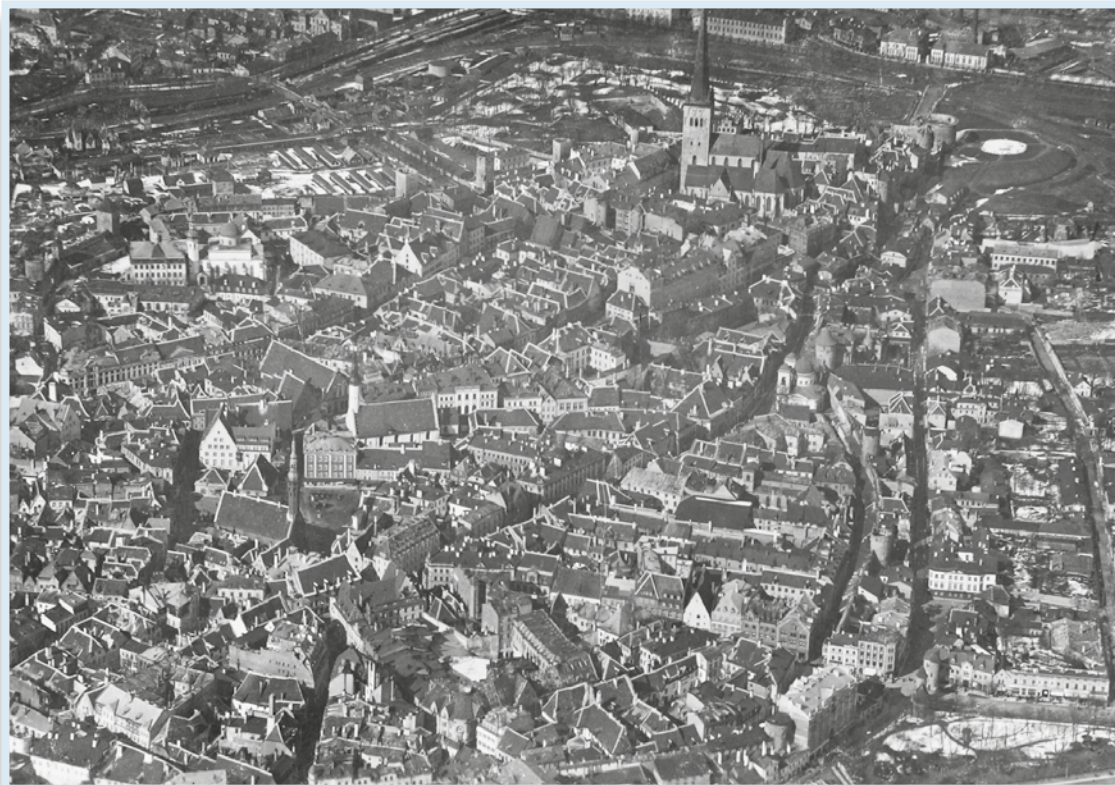
Tallinna vanalinn linnulennult 1920. aastate keskpaigas.

15. mail tähistatakse aga tänapäeval igal aastal Tallinna päeva. Vana hansalinn ei unusta oma sünnilugu.