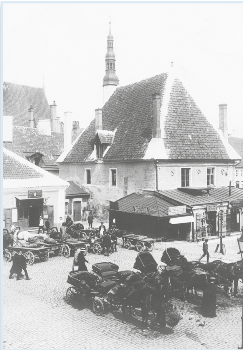
Raekoja platsi melu vaekoja juures 19. ja 20. sajandi vahetusest.