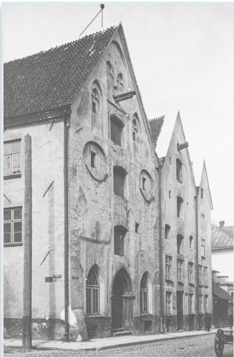
Keskaegsete linnakodanike majade grupp Kolm Õde Pika tänava ääres sadakonna aasta eest.