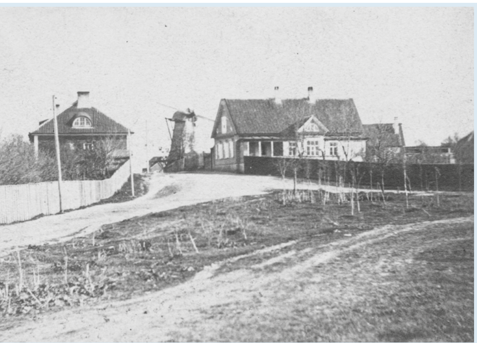
Võimalik, et vanim foto Tõnismäest. Vaade 1870. aasta paiku Kaarli puiesteelt Tõnismäe tänavale. Alles on veel vana tuuleveski.