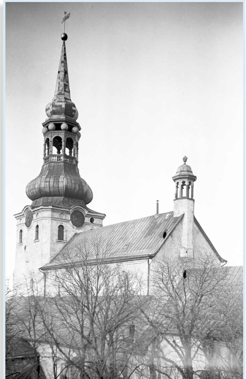
Toomkirik 20. sajandi alguses.

Toomkool muutus aja ajapikku baltisaksa noormeeste kooliks, mis suleti mõneks ajaks venestusajal 19. sajandi lõpus. 1939. aasta oktoobris, kui algas baltisakslaste ümberasumine, sulges toomkool oma ukse. Tundus, et selle vana ja väärika kooli ajalugu on läbi saanud. 2011. aastal taastati aga toomkool väikese kristliku erakoolina, mis peab end toomkooli sajandeid püsinud vaimsuse edasikandjaks.