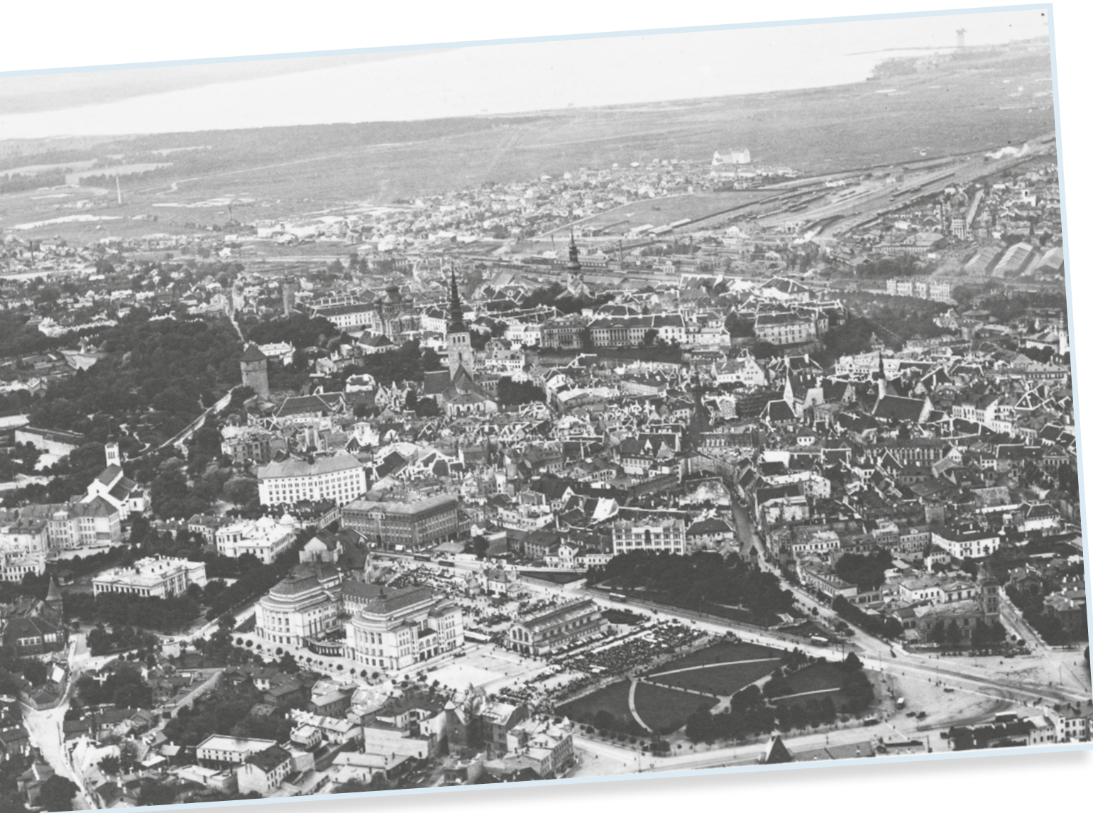
Vaade Tallinna südalinnale 1930. aasta paiku.

mõnegi loo puhul olen sidunud kohaliku ajaloo samaaegsete arengutega mujal Eestis või laias maailmas.